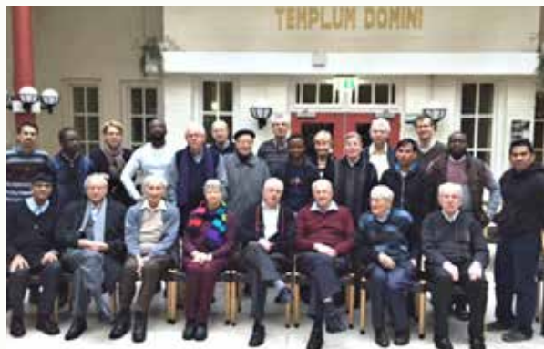
Deelnemers aan NEB-kapittel 2016, over diversiteit gesproken...

Leden van andere congregaties vragen ons soms: "Hoe kan het dat bij jullie zoveel nationaliteiten samenleven en -werken? Het lijkt wel of het in jullie genen zit."