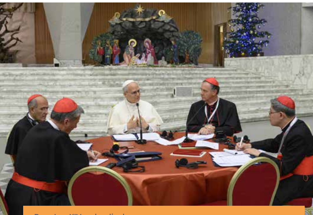
Paus Leo XIV en kardinalen

In januari 2026 kwamen kardinalen uit alle delen van de wereld samen in Rome voor een buitengewoon consistorium. Deze zeldzame bijeenkomst, bijengeroepen door paus Leo XIV, stond niet in het teken van benoemingen of formele besluiten, maar van luisteren, bezinning en gezamenlijke onderscheiding. Het centrale inzicht dat uit het overleg naar voren kwam, liet zich samenvatten in één zin: missie begint met liefde.