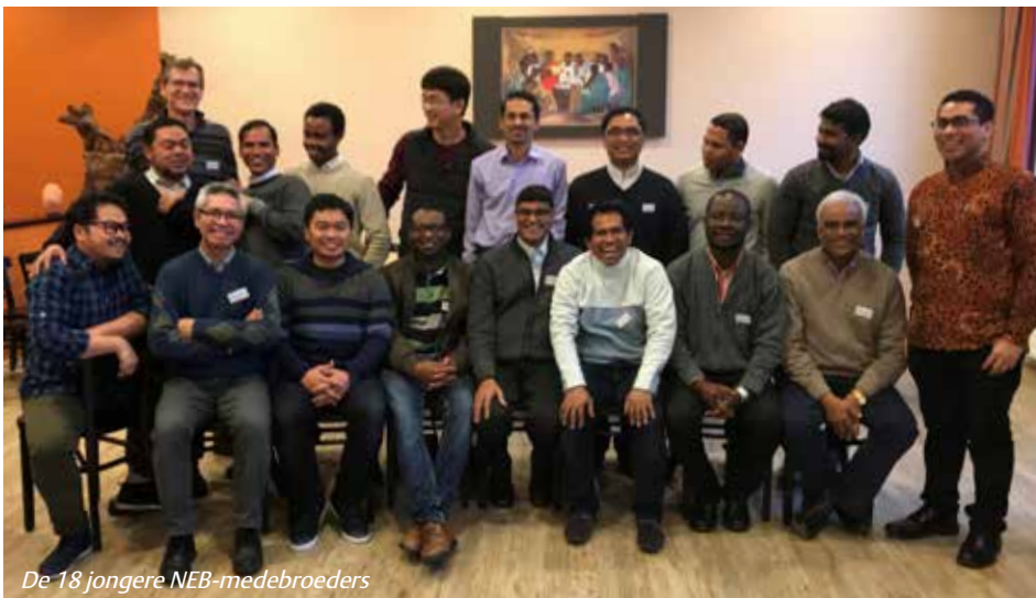
De 18 jongere NEB-medebroeders