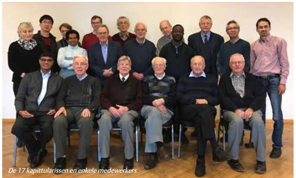
De 17 kapittularissen en enkele medewerkers

Het was een mooie ervaring te zien hoe jong en oud elkaar gedurende deze dagen hebben gevonden. Er is