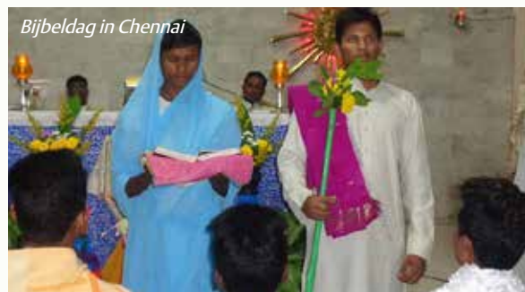
Bijbel-dag in Chennai